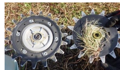
Erba accumulata tra le lame

Se si accumula erba tra le lame non continuerete a lavorare, l'erba non verrà tagliata appropriatamente e diminuirà l'efficienza di taglio. Alla fine, il reciprocatore si bloccherà.