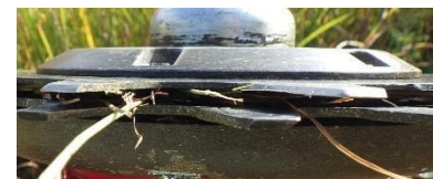
Interstizio tra le lame

Controllate e rimuovete l'erba tra le lame